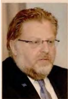
Γράφει ο ΔΗΜΗΤΡΗΣ ΔΕΜΟΣ Αντιπρόεδρος ΠΙΕΦ αναπληρωτής διευθύνων σύμβουλος DEMO ABEE